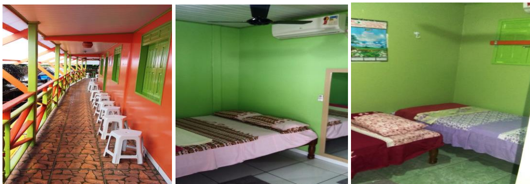
Pátio da pousada e estrutura das suítes.

Localizada na rua Generalíssimo Deodoro, bairro centro, Telefone (91) 99246-1677, próximo a farmácia