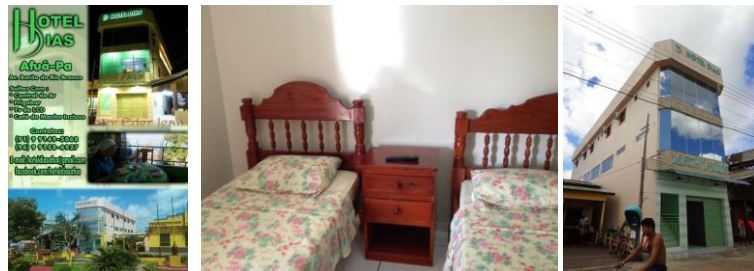
Banner de Divulgação, Estilo de suíte e Frente do Hotel

Localizado na Avenida Barão do Rio Branco, em frente ao Trapiche Municipal.