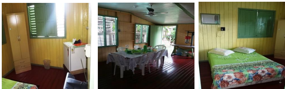
Estrutura das suítes e quartos e cozinha

continua com as atividades de hospedagens. Contatos e reservas (96) 99112-3929 / (91) 99387-6988.