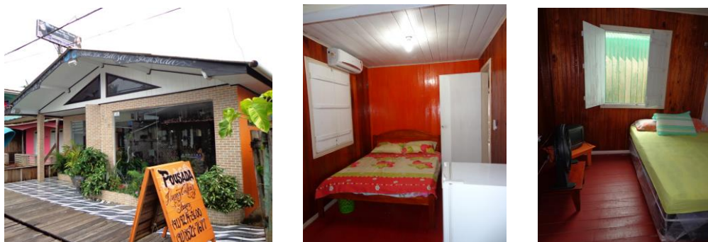
Frente do Hotel e estrutura

Localizado na travessa Sanches de Oliveira, nº 360, bairro centro, Telefone (96) 991618694, próximo ao laboratório biomédico.