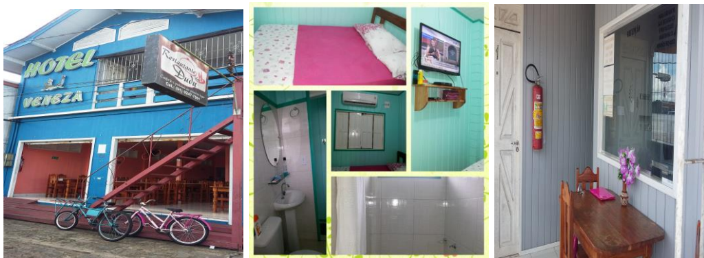
Frente do Hotel e estrutura

Localizado na Avenida Floriano Peixoto, nº 19, Beira mar, próximo ao banco Bradesco,. Contato e reservas: Doranildo 091- 99247 7566 / 091 91742377. Os valores das diárias são R$ 55,00 uma pessoa, R$ 65,00 Casal e R$ 80,00 triplo.