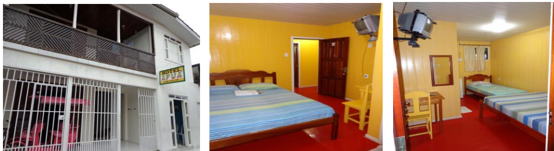
Frente do hotel Afuá, estrutura de suíte casal e solteiro

Localizado na Avenida Mariano Candido de Almeida, nº 50, bairro centro, Telefone (91) 9115-5589