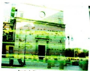
Igreja de São Lúçifer, em Cagliari